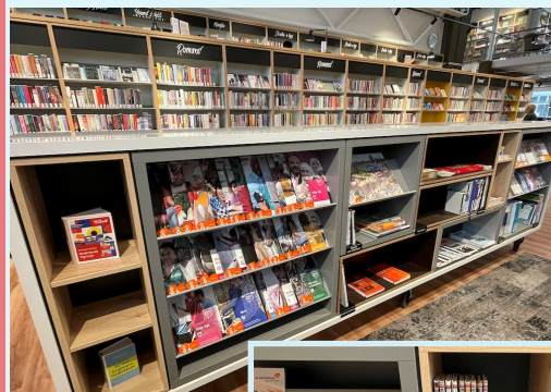
De leerkant met lesmethodes, materialen, woordenboeken, docentenboeken, boeken over Nederland en 3 series Spreektaal

De keuze is reuze! Doe er vooral je voordeel mee en wijs je taalleerder er ook op!