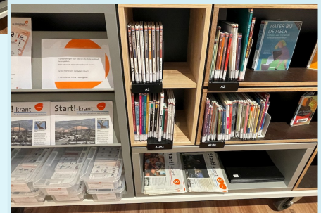
De leeskant met leesboeken op niveau van A1 t/m B2, de startkrant en de taalwandelingen

De nieuwste nieuwsbrief van Het Begint Met Taal