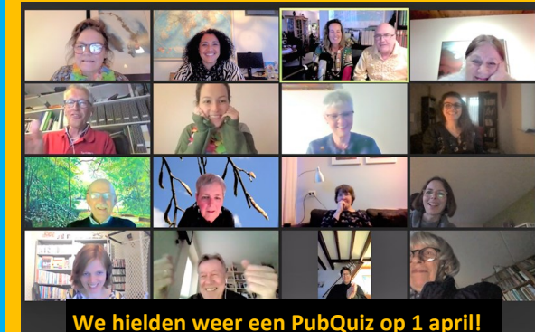
We hielden weer een PubQuiz op 1 april!

Hoe houden we het vol, nog steeds kunnen we geen lesjes geven of even spontaan binnen lopen in onze thuishaven. Hoe lang is die tunnel nog, voordat we eindelijk wat licht zien? Afijn, ondanks de beperkingen zijn er nog volop activiteiten! Lees hier over de afhaalbibliotheek en meer en hier de goed gevulde agenda van het Digi-Taalhuis . Doe er je voordeel mee en dat van je leerling!